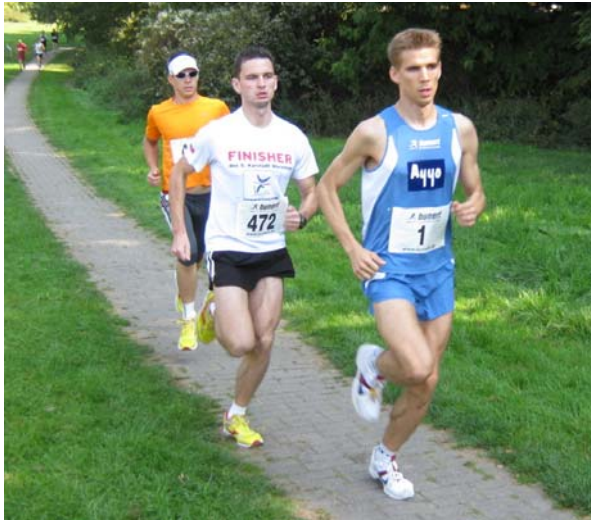
Streckenverlauf Jedermannlauf / Hauptlauf (2 Runden)